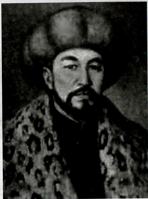
20 января 2015 г.