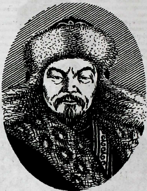
Портрет Алымбек-датки Асанканов А.А., Осмонов О.Ж. История Кыргызстана. – Б., 2002. –С.245.