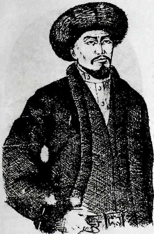
Портрет Алымбек-датки Т. Кенесариев «Кыргызстандын орусияга каратылышы». – Б., 1997.