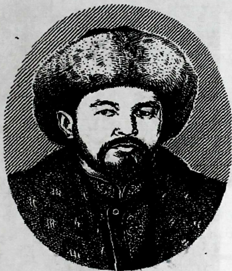
Портрет Алымбека-датки «Кыргыз тарыхы. Энциклопедия. –Б., 2003. –С.111; Чотонов У., Нур уулу Досбол «История отечества» - Б, 2009. –С. 114.